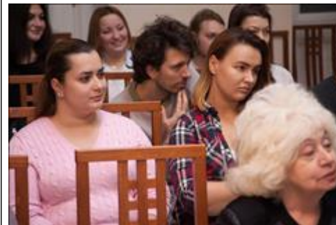
Слушатели В простой и занимательной форме лектор раскрыл современную проблематику музыкальной культуры