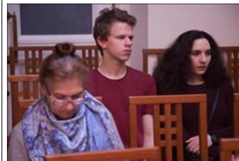
Слушатели Вопросы математики раскрывались доступно для людей с разным уровнем подготовки