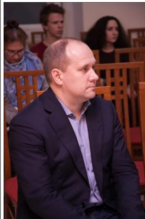
Тема вызвала интерес Вопросы в конце лекции показали вдумчивое отношение к математическому аппарату и методологии, изложенной лектором