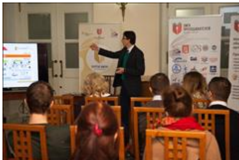
Лектор и слушатели Тема лекции вызвала дискуссию