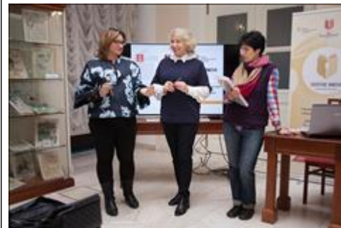
Организаторы и представитель РГБ Была передана Книга Почета, благодарность руководству РГБ от Лиги за совместный проект