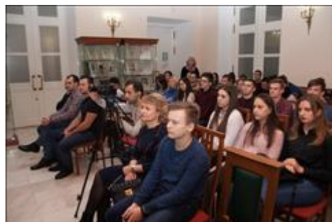
Слушатели Присутствовало 67 человек