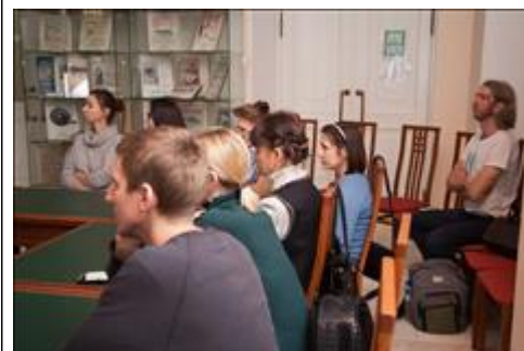
Слушатели Зал норных рукописей