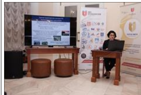
Лектор Использовалась презентация, велась видеосъемка