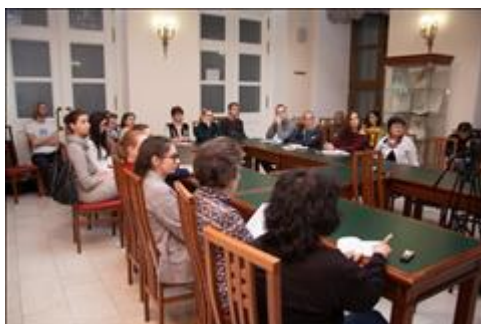
Слушатели Присутствовало 37 человек